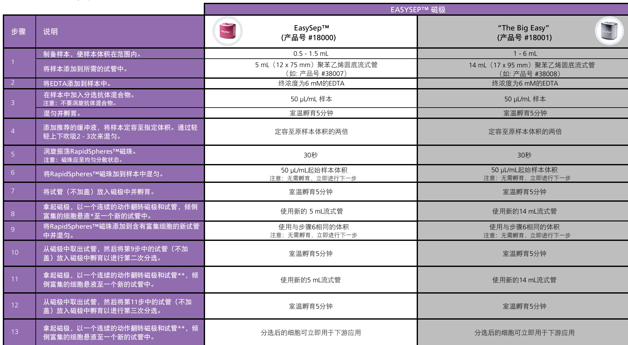
表2.用于脐带血样本的EasySep™ Direct 人 PBMC 分选试剂盒操作流程

请参阅第1页了解样本制备和推荐缓冲液。有关每种磁极的详细使用方法，请参阅表2和表3。