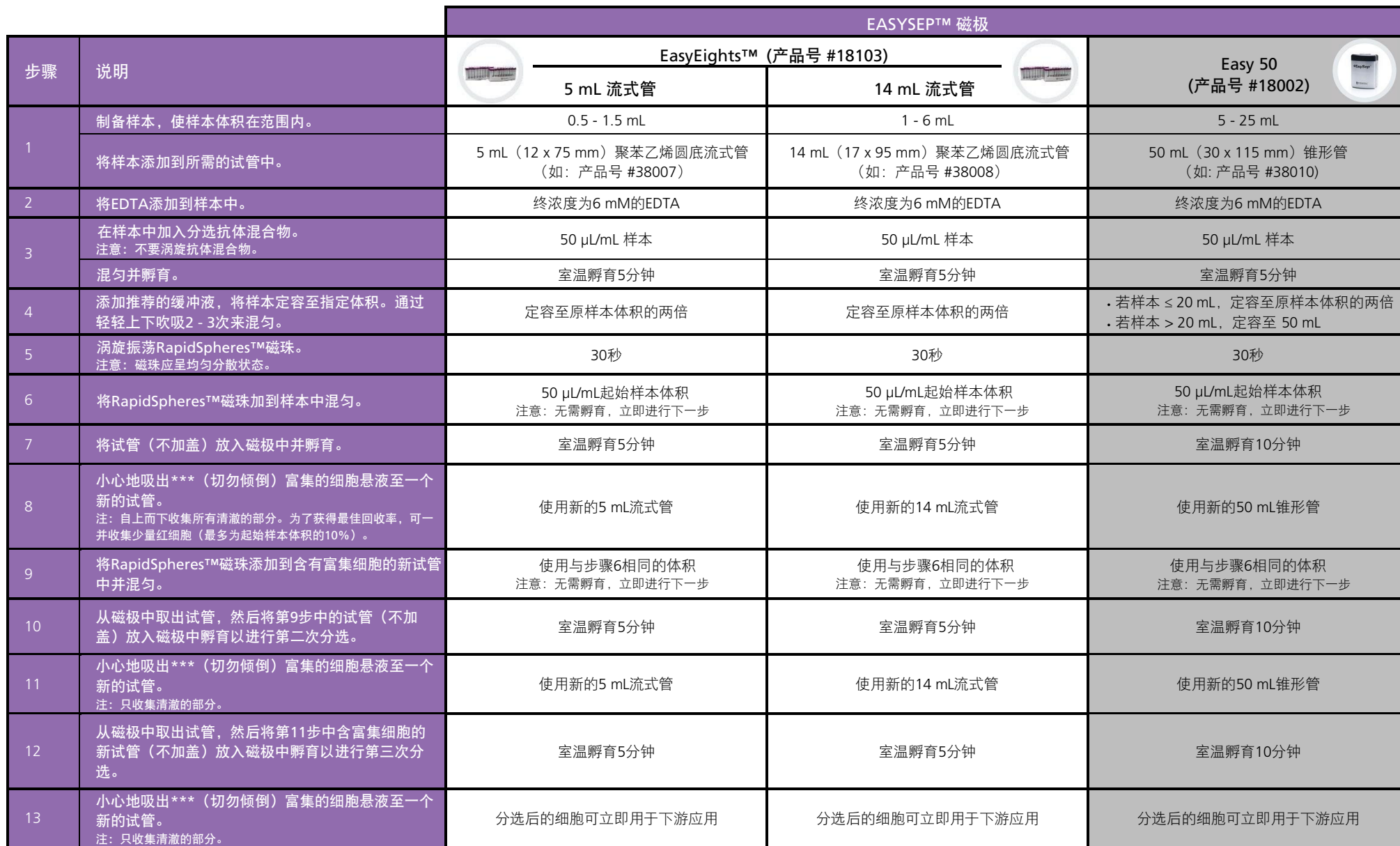
表3.用于脐带血样本的EasySep™ Direct 人 PBMC 分选试剂盒操作流程