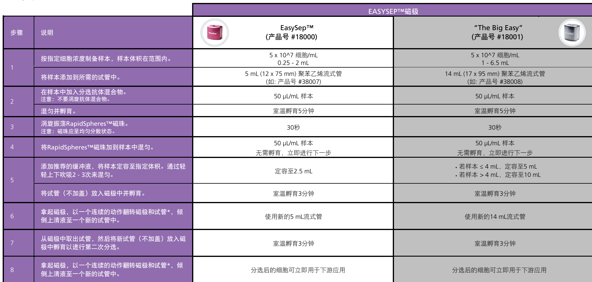
表1.EasySep™人嗜酸性粒细胞分选试剂盒操作流程

请参阅第1页了解样本制备和推荐缓冲液。有关每种磁极的详细使用方法，请参阅表1和表2。